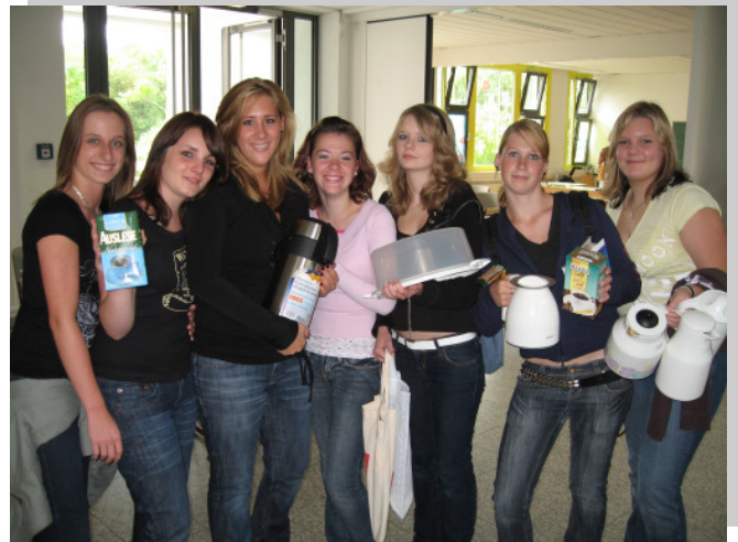
Die Klasse 10a bewirtete die Eltern am Tag der Schuleinführung der 5. Klassen. Mit dem Verkauf von Kaffee und Kuchen reduzieren sie die Kosten ihrer Klassenfahrt nach England vom 3. bis 8. September.